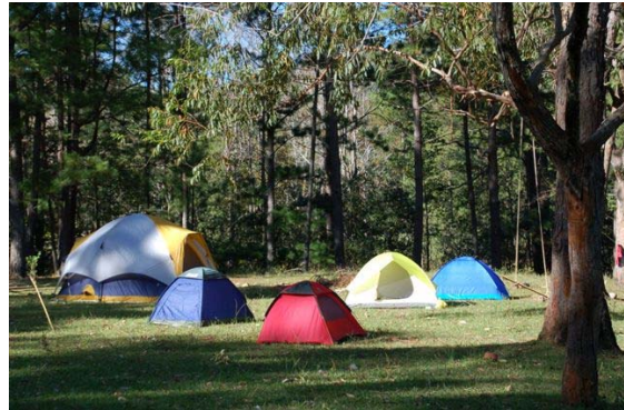
Oude tentjes zijn meer dan welkom!

Wie heeft er nog circusmateriaal, theater-spullen, computers, speelgoed en tenten over? Op korte termijn vertrekt er weer een container per schip naar Honduras. Het is vermoedelijk de laatste kans het komend jaar om gratis goederen naar Arte Acción te verscheppen. Het is wel kort dag: tot 16 april kunnen de spullen worden aangeleverd bij Wim en Marian Joosten, Holtweg 2 in Arnhem, 026- 4433071.