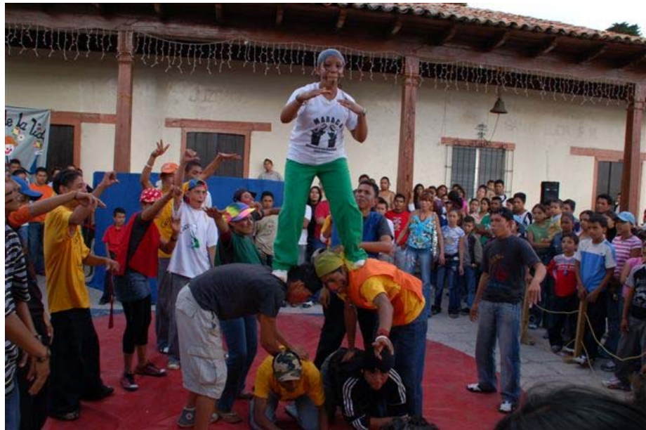
Circusoptreden in Santa Lucia

Tijdens een van de kampvuren vertelde een jongen ons hoe blij hij was met het circus. Hij zei er niet aan te moeten denken waar hij zou zijn als El Circo de la Vida er niet zou zijn - vermoedelijk in de gevangenis. Daar krijg je kippenvel van!